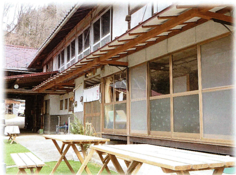
早春の田舎カフェ 2022年3月中旬撮影

西山「中条」に遅い春がやってくると、雪融けとともに、風が運んだ春の匂いに誘われ、村人たちの野良仕事も始まりました。中条にある「田舎カフェ」では、お客さまに楽しいひと時をお過ごしいただけるよう以下のとおりコンサートを計画しました。街中にはないゆったりとした時間が流れる早春の山里で、ごゆっくり音楽とお食事をお楽しみください。